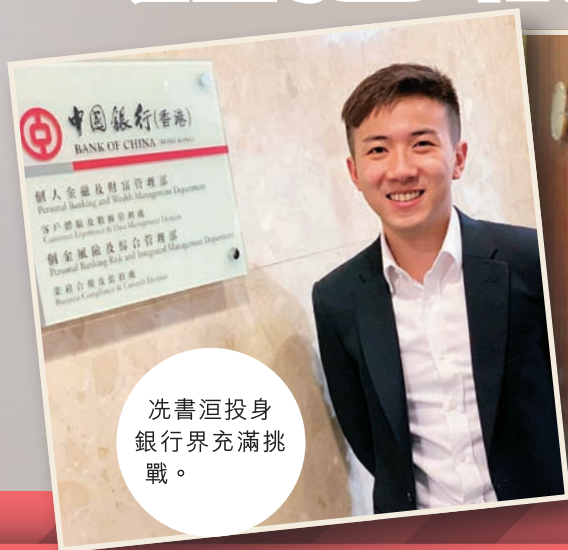
冼書洵投身 銀行界充滿挑 戰。