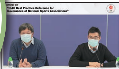
2021年1月27日廉政公署 — 體育總會防貪錦囊簡介會