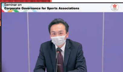
2020年12月23日香港管理專業協會 — 體育總會企業管治簡介會