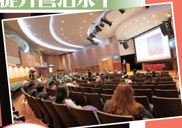
2020年11月23日 體育總會機構管治小組 舉行簡介會。