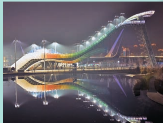
「水晶鞋」成為一個「打喺聖地」。