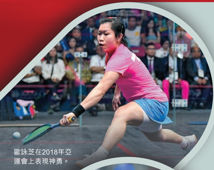
歐詠芝在2018年亞運會上表現神勇。