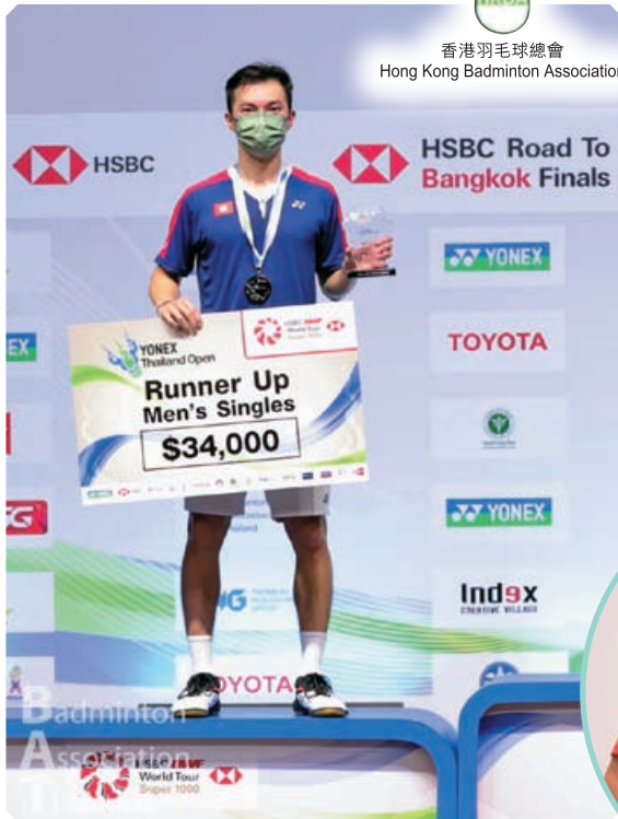
伍家朗在泰國之行獲得亞軍。