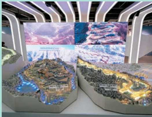
北京冬奧會的規模令人讚嘆。