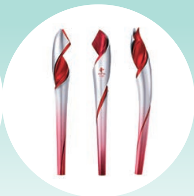
北京2022年冬奧會火炬