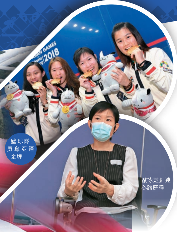
壁球隊 勇奪亞運 金牌