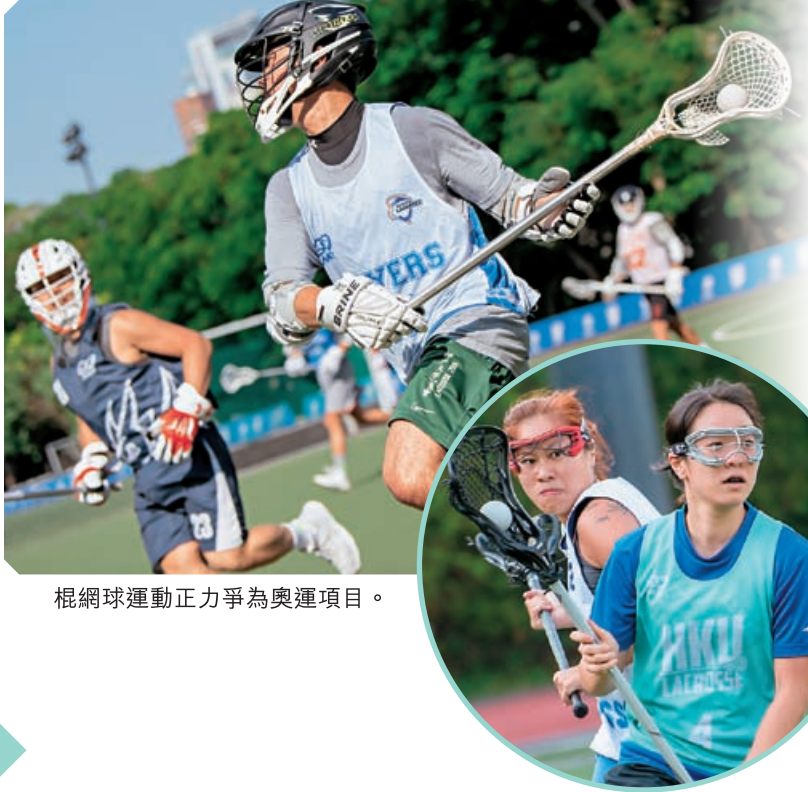
棍網球運動正力爭為奧運項目。

受疫情影響下棍網球賽事停擺多個月。隨著球場陸續重開，香港棍網球總會宣佈於今年4月2至4日於香港大學何鴻燊體育中心舉辦「香港棍網球六人邀請賽」，是繼2019年首次舉辦的本地六人棍網球聯賽後，再次舉辦六人賽例的比賽。