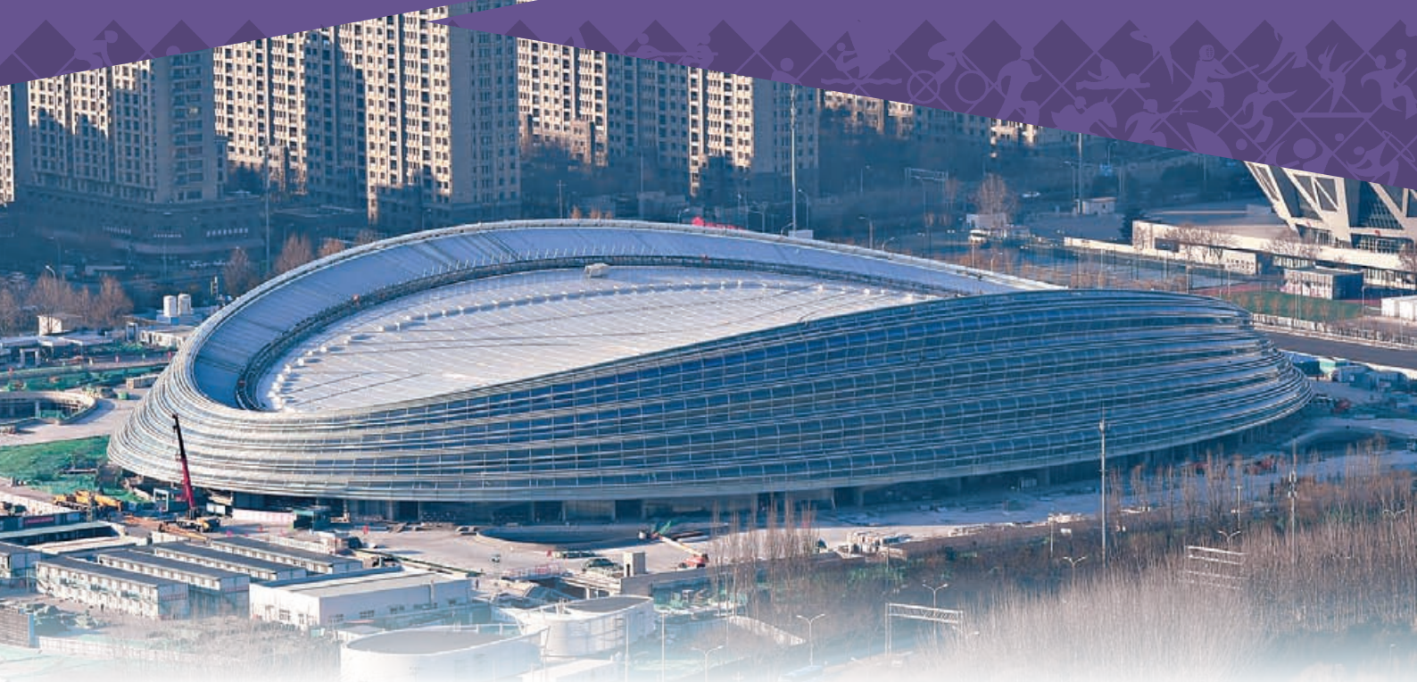
又稱「冰絲帶」的國家速滑館成為今屆冬奧的標誌建築。